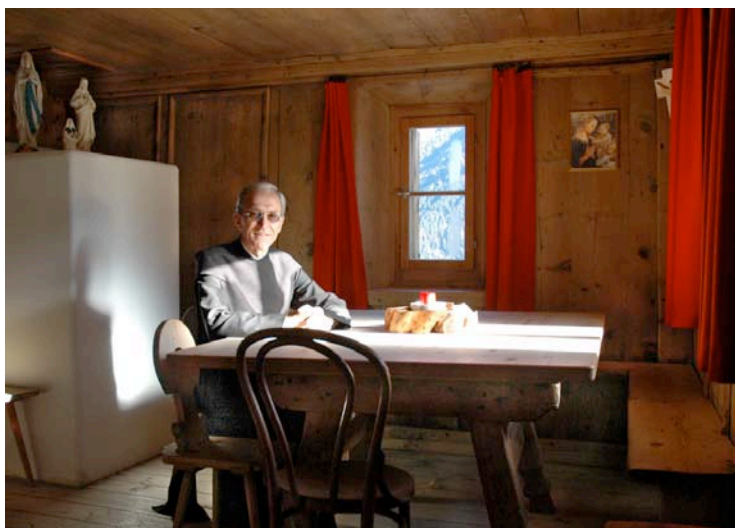
Die Stube mit Ofen