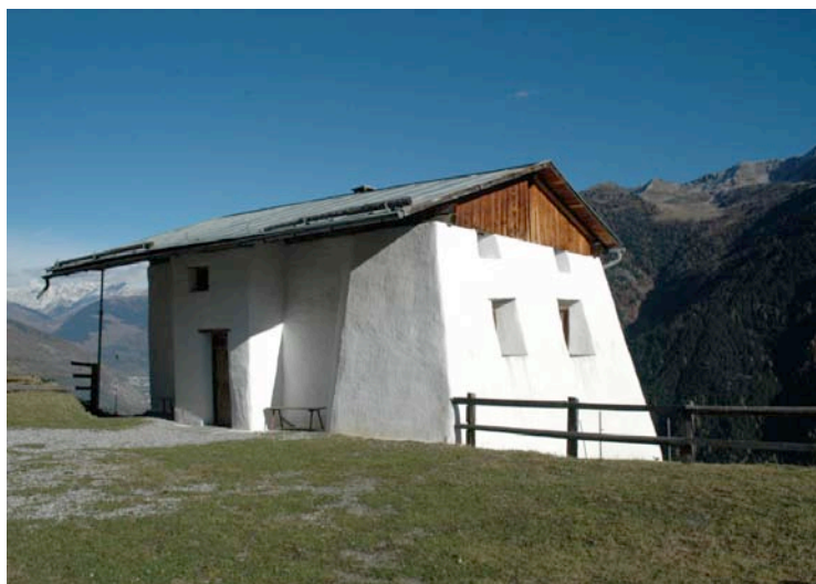
Die Maiensäss hoch über dem Val Müstair