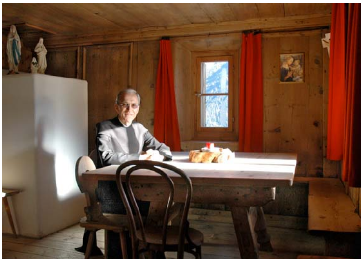
Die Stube mit Ofen